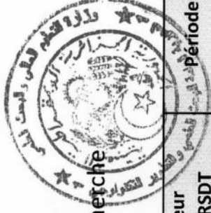
Tableau des établissements d'enseignement supérieur à couvrir par le Centre de Recherche Scientifique et Technique en Analyses Physico – Chimiques -CRAPC

Campagne de vulgarisation relative à la plateforme « Ibtikar »