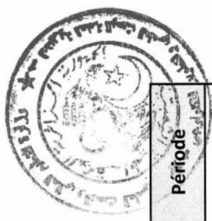
Tableau des établissements d'enseignement supérieur à couvrir par le Centre de Développement des Technologies Avancées-CDTA

Campagne de vulgarisation relative à la plateforme « Ibtikar »